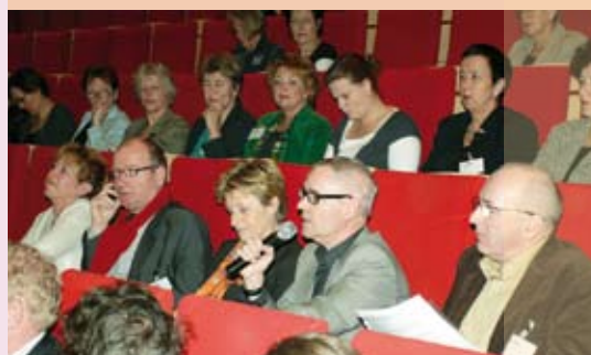
Impressie deelnemers zaal