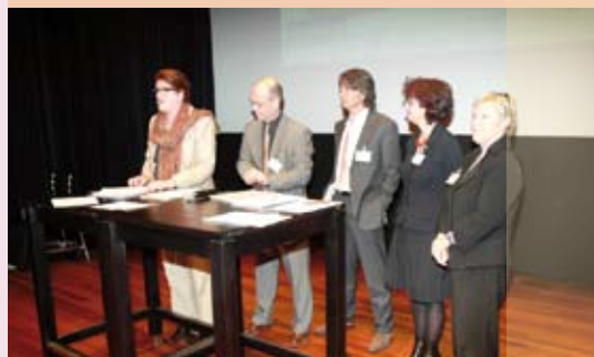
Bestuur tijdens Algemene Ledenvergadering