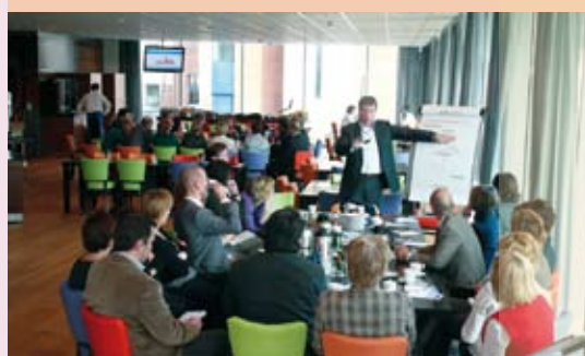
Thematafels Vrijheid en Verbondenheid